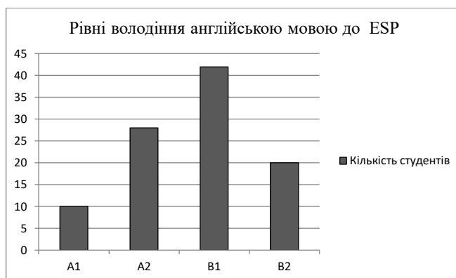
Рис. 1. Рівні володіння англійською мовою студентів до впровадження ESP

Після завершення ESP-курсу спостерігається суттєва позитивна динаміка. Кількість студентів з рівнем A1 зменшилася до 10 осіб (8,3 %), з рівнем A2 – до 28 осіб (23,3 %). Водночас кількість студентів з рівнем B1 зростає до 42 осіб (35 %), а з рівнем B2 – до 20 осіб (16,7 %).