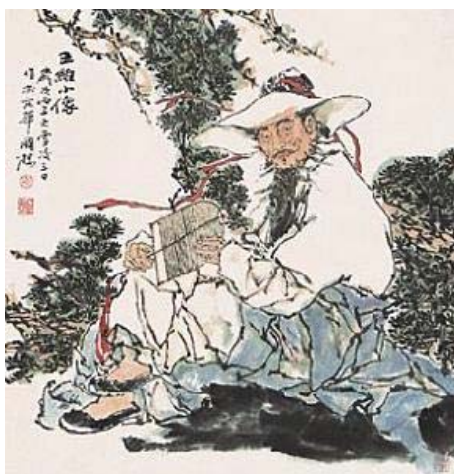
Рис. 2. «Китайська мініатюра»

форми китайської поезії періоду династії Тан, зокрема епіграми, філософська, пейзажна, емблематична лірика та монохромний живопис тушшю у стилі «гір і вод», засновником якого вважається Ван Вей. Наприклад, його «Китайська мініатюра» (див. рис. 2).