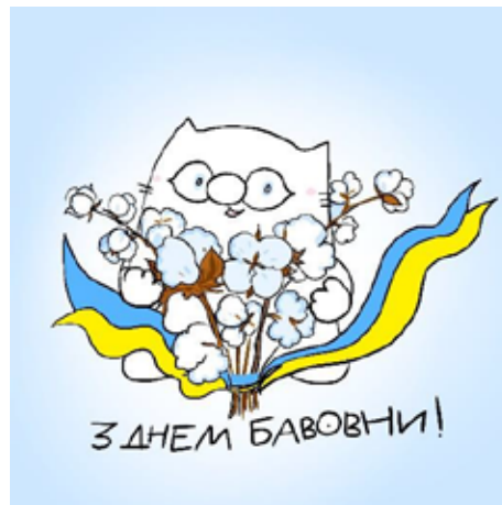
Рис. 4. Мем про бавовну, авторка – Олена Павлова

Мем про бавовну (рис. 4) висміюють манеру російських ЗМІ називати вибух хлопок . Тут закладено гру слів, що стосуються ударів у долоні і рослини. Тому вибухи в росії та на території окупованого Криму під час російсько-української війни почали саркастично називати бавовною.