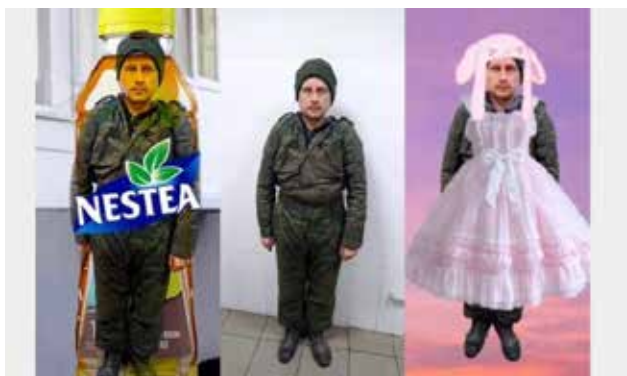
Рис. 3. Мем Чмоня

Креолізація часто характеризує мовця або предмет чи особу про яку йдеться, надає мему комічного та навіть іронічного емоційного забарвлення, певної прагматичної маркованості [2]. Зовнішня схожість глави Європейської ради Шарля Мішеля, прем'єр-міністра України Дениса Шмигала та керівника Міністерства оборони України Олексія Резнікова надихнула українців на низку мемів. До світліни Мішеля та Шмигала, зробленої під час візиту європейського політика до Одеси, прифотошопили Резнікова. Зображення-мем стало джерелом для однослівних мемів, утворених від назв, які часто плутають: Черкаси – Чернігів – Чернівці: балаклава – бакалія – Балаклія; Корець – Кременець – Крупець; Саксаганського – Сагайдачного; Австрія – Австралія тощо.