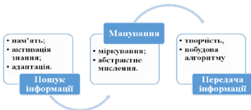
Рис. 1. Когнітивний процес пошуку аналогій

у процесі міркування) та міркування за аналогією (правдоподібне міркування, в якому висновки про наявність ознаки в предмета роблять на підставі його схожості в істотних рисах з іншим предметом). Ми розрізняємо такі два типи аналогічних зв'язків, як передання лише структурних відношень між двома елементами і пошук аналогій за класичними методами. Однак в обох випадках аналогічний висновок заснований на невизначеному аналогічному відображенні, яке не обов'язково має бути істинним. Пошук гіпотез, які узагальнюють логічний висновок, також відбувається через пошук абстрактної аналогічності, що становить двошарову процедуру, як-от визначення спільної структури ОО й ОП через узагальнення, схематичне відображення ОО на ОП через загальну структуру.