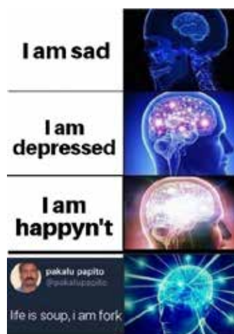
Рис. 2. Мем із вербальною темою та невербальною ремою (2) [2]

У наступному прикладі тема представлена градацією ( I am sad I am depressed I am happy'n't life is soup, I'm fork ), у якій автор використовує оказіоналізм I am happy'n't для погіршення самопочуття й метафору life is soup, I'm fork , яка означає, що життя біжить крізь твої пальці й ти нічого не можеш зробити. Напруженість зростає з прочитанням кожної наступної фрази. Емоційна розрядка в ремі досягається за рахунок парадоксу: чим більш хаотична, незрозуміла думка з лівого боку, тим вона вища в ієрархії розуму. Можна дійти висновку, що в найгірші моменти життя людина здатна згенерувати найгеніальнішу ідею.