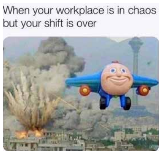
Рис. 3. Мем із вербальною темою та невербальною ремою (3) [4]

логічна пауза ( When your workplace is in chaos but your shift is over ). Напруженість теми змінюється комічною реакцією в ремі за рахунок гіперболи та сарказму. Гіпербола невербально представлена вибухом будівлі, а сарказм – веселою посмішкою літака, який вирвався з «пекла», що залишилося позаду. Приклад показує нам прецедентну ситуацію, яка іронізує закінчення робочого дня й небажання виправляти щось, бо настав час іти додому, залишаючи безлад на робочому місці.