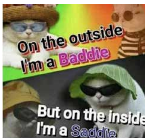
Рис. 4. Мем із невербальним дублюванням теми та реми (4) [1]

морфологічних, лексичних і стилістичних засобів. Зазначимо, що «кожній ремі властива розгортаність змісту, яка досягається шляхом додавання нових «крихт» значення, які рухаються у формі спіралі, де кожен наступний виток відповідає новим фрагментам інформації» [6, с. 120]. Рема залежить від доцільності добору автором думок, закономірності його мислення та комунікативних здібностей.